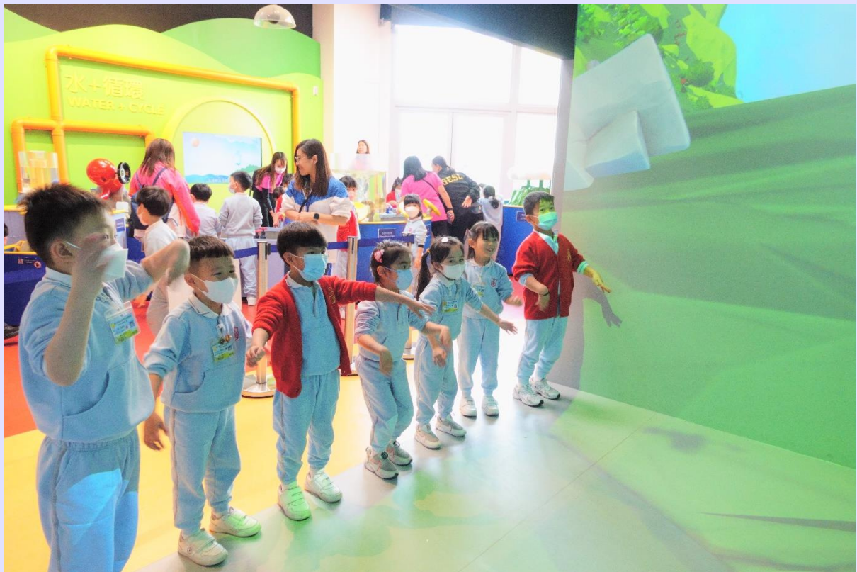
幼兒透過參與立體影像遊戲，認識有關水資源的資訊。