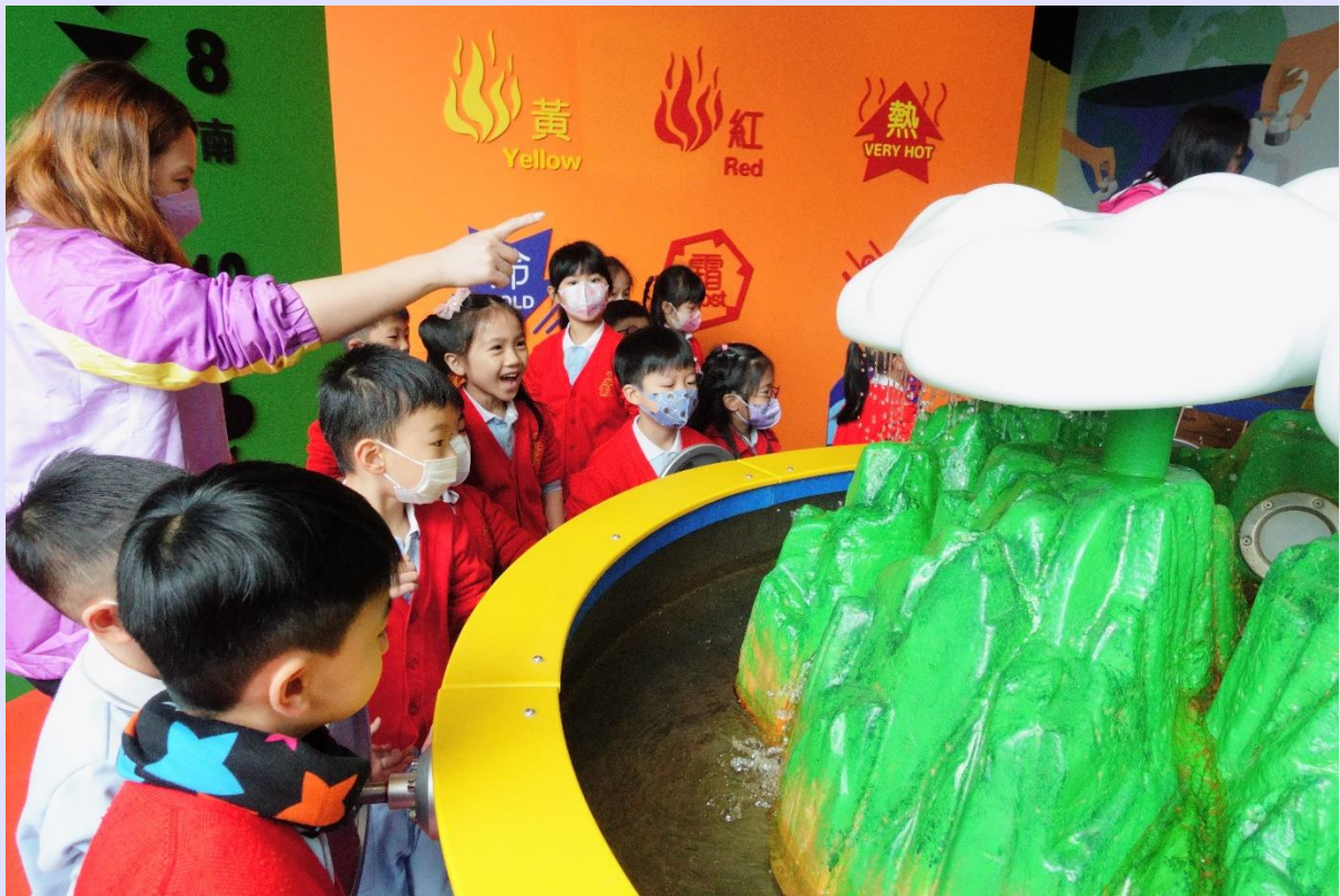
幼兒在不同的展區，了解水循環的過程。